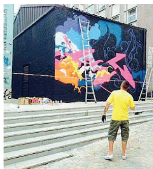
A lavoro l'writer all'opera