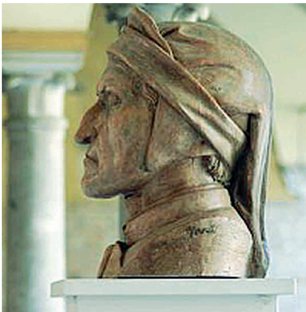
In esilio Dante Alighieri è morto a Ravenna nel 1321 dove è stato sepolto. Lontano dalla sua Firenze

Una poesia incastonata prima nel Convivio, poi citata nel De vulgari eloquentia , riproposta infine nel II canto del Purgatorio , quando chiede all'amico Casella di cantargli ancora quei versi che aveva messo in musica, per placargli l'affanno del grande viaggio. Un incipit che «ci permette di affrontare un grande arco tematico nell'intreccio essenziale della poesia di Dante», sottolinea il direttore artistico Domenico De Martino. Un progetto che cresce di anno in anno, tra mostre, incontri e spettacoli (tutti a ingresso libero), approfondisce e diffonde la conoscenza e la consapevolezza dell'importanza del Sommo Poeta per la cultura italiana ed europea. Dante2021 è infatti anche una tessera fondamentale nel percorso di Ravenna Capitale europea della Cultura 2019. La Ravenna dantesca è il palcoscenico della rassegna che si apre mercoledì 10 settembre